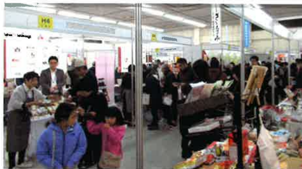
ビジネスフェア中四国 2019の様子

バイヤーとの交渉により、新たな販路を開拓することができました。また「消費者の生の声」を聴くことができ、大変参考になりました。(広島安芸商工会会員)