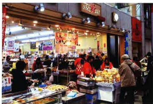
市町村情報センターひろしま夢ぶらざ店内、店頭の様子